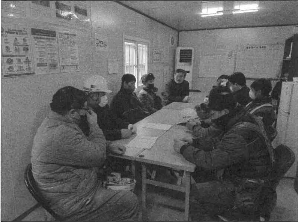
2022.01.25 노사협의체 회의